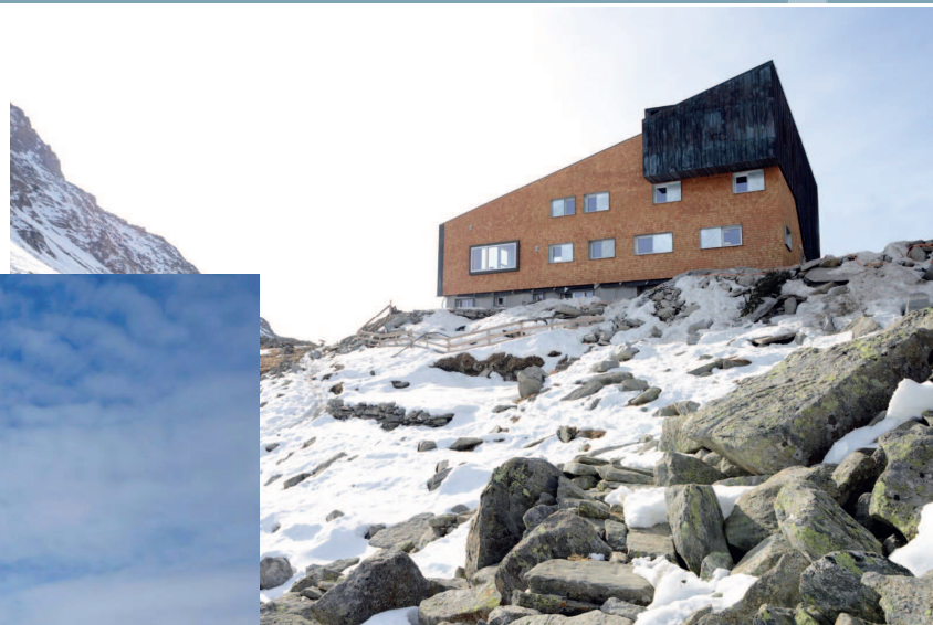
Edelrauthütte Rifugio Ponte di Ghiaccio

#halbzeit #primtemp #halbzeit #primotempo #primotempo