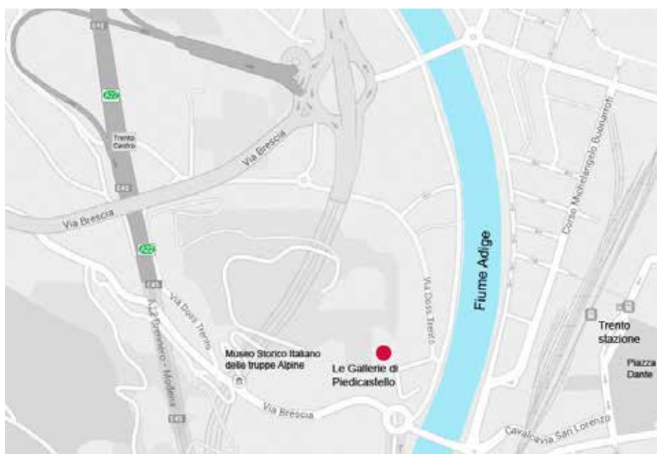
Trento: Gallerie di Pedicastello Via Brescia