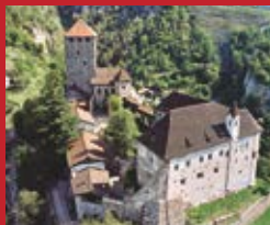
Schloss Tirol Castel Tirol

Luserna/Lusérn, l'isola cimbra delle Alpi, a Castel Tirol