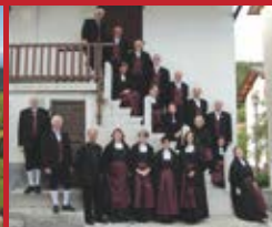
Corale Polifonica Cimbra