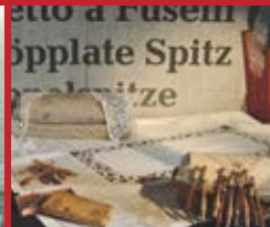
Klöppelspitzen aus Lusérn Merletto di Luserna