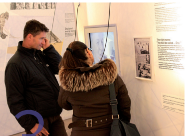
3 Südtiroler Archäologiemuseum Museo Archeologico dell'Alto Adige