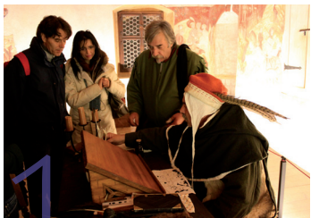
1 Schloss Runkelstein Castel Roncolo