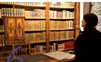
6 Mercantilmuseum Museo Mercantile