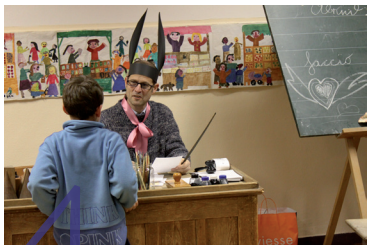
4 Schulmuseum Museo della Scuola