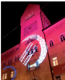
2 Stadtmuseum Museo Civico