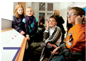
7 Naturmuseum Südtirol Museo di Scienze Naturali dell'Alto Adige