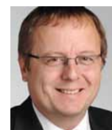
Johann Dietrich Wörner

Sparkasse Academy / Academy Cassa di Risparmio