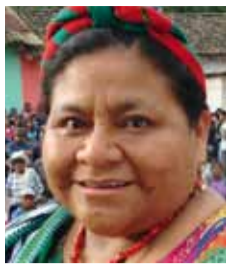
Rigoberta Menchú Tum

Friedensnobelpreisträgerin 1992 Premio Nobel per la Pace 1992