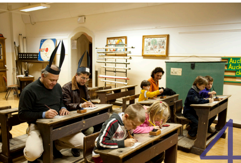
4 Schulmuseum Museo della Scuola