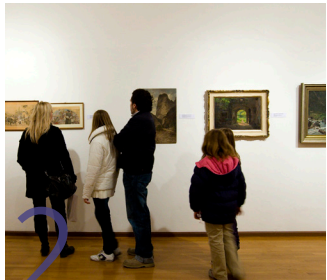
2 Stadtmuseum Museo Civico