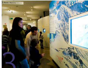
3 Südtiroler Archäologiemuseum Museo Archeologico dell'Alto Adige