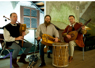
1 Schloss Runkelstein Castel Roncolo