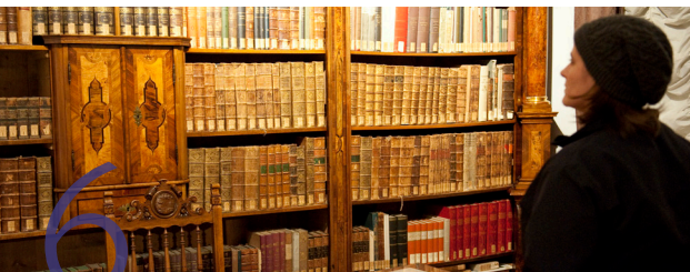
6 Merkantilmuseum Museo Mercantile