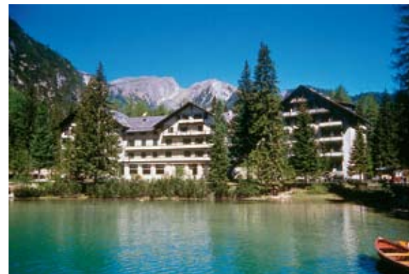
Der Tagungsort: Das Hotel „Pragser Wildsee“.

1939 mussten die deutsch- und ladinischsprachigen Südtirolerinnen und Südtiroler sich für die Abwanderung ins Deutsche Reich oder den Verbleib im Königreich Italien entscheiden. 70 Jahre danach ist dies ein Anlass, um kritisch auf einen der einschneidendsten Momente der jüngeren Südtiroler Geschichte zurückzublicken.