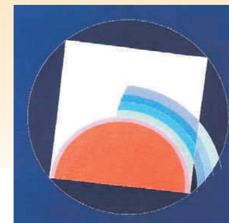
Eugenio Carmi: La sfera dell'indovina