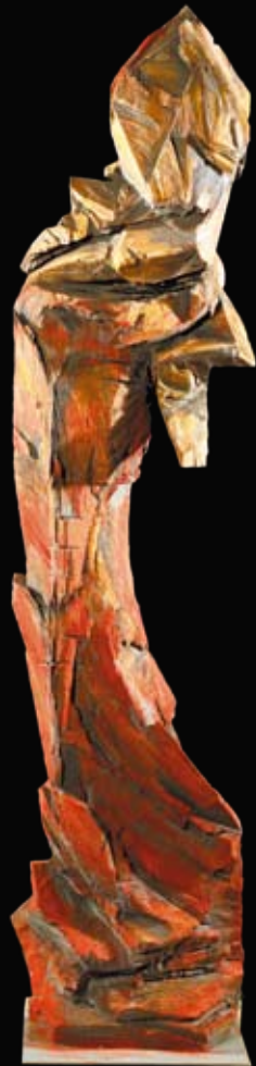
Johann Ribí von Lenzburg Bischof von Brixen Vescovo di Bressanone Bishop of Bressanone

www.schlosstirol.it - www.casteltirol.it