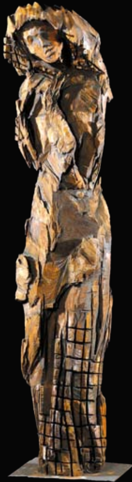
Margarete Gräfin von Tirol Margareta Contessa del Tirol Margareth Countess of Tyrol