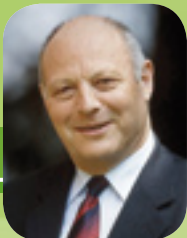
Dr. Luis Durnwalder Landeshauptmann Presidente della Provincia

Il Centro provinciale revisione veicoli sarà attivato a breve in qualità di moderna struttura a disposizione per le revisioni e i collaudi dei veicoli, facilmente accessibile al cittadino. Ciò non rappresenta solo un miglioramento decisivo per l'attività degli addetti ai lavori, bensì crea anche i presupposti per un servizio al cliente sempre più efficiente. Saremo lieti di darLe il benvenuto all'inaugurazione del Centro.