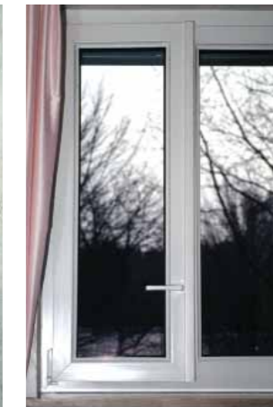
Maniglia della finestra posizionata in basso