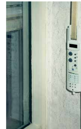
Motore da installare alle tapparelle di casa