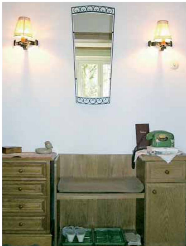
8 Arredamento dell'atrio con sedile

Se il suono del campanello della porta fosse troppo basso, si può ricorrere ad un segnale acustico a due toni o ad un campanello con segnale luminoso.