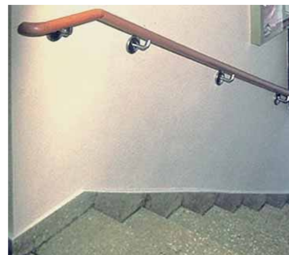
Il corrimano: la lunghezza deve superare l'ultimo gradino di almeno 30 cm

L'illuminazione deve essere sufficiente e il timer va regolato in modo che la luce non si spenga improvvisamente nei tratti di scala più lunghi. Se lo spazio disponibile lo consente, si possono prevedere dei sedili per soste temporanee. La tromba delle scale può essere adattata nel tempo per rispondere