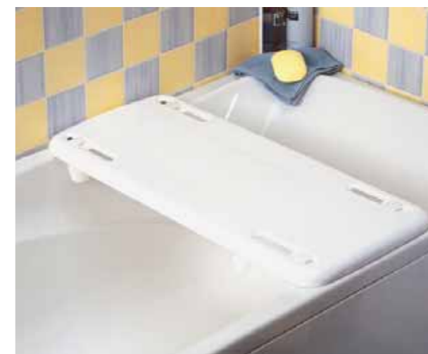
Seggiolino per fare la doccia da seduti