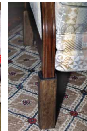
Altezza di seduta non idonea e idonea