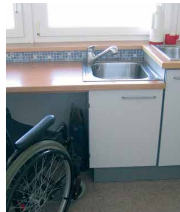
Piano di lavoro accessibile alla sedia a rotelle