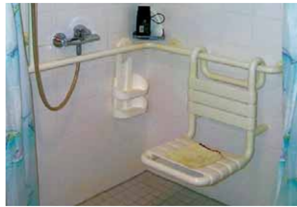
Il seggiolino da doccia va fissato accuratamente

Se si sta realizzando una ristrutturazione, si consiglia di installare una porta sufficientemente larga o di sostituirla con una porta scorrevole.