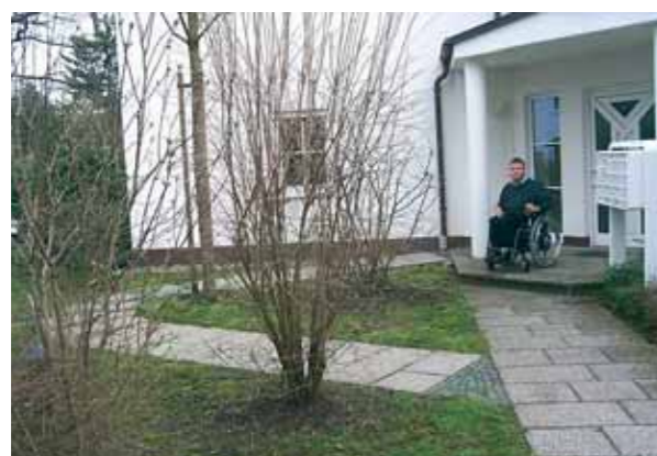
6 La rampa d'ingresso: Indispensabile in presenza di gradini

Per evitare cadute, gli zerbini dovrebbero essere antiscivolo e a filo di pavimento.