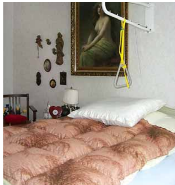
La maniglia aiuta ad alzarsi

Accanto al letto deve essere presente un ampio piano di appoggio per avere a portata di mano il telefono, il dispositivo per le chiamate d'emergenza e tutto ciò di cui si ha spesso bisogno.