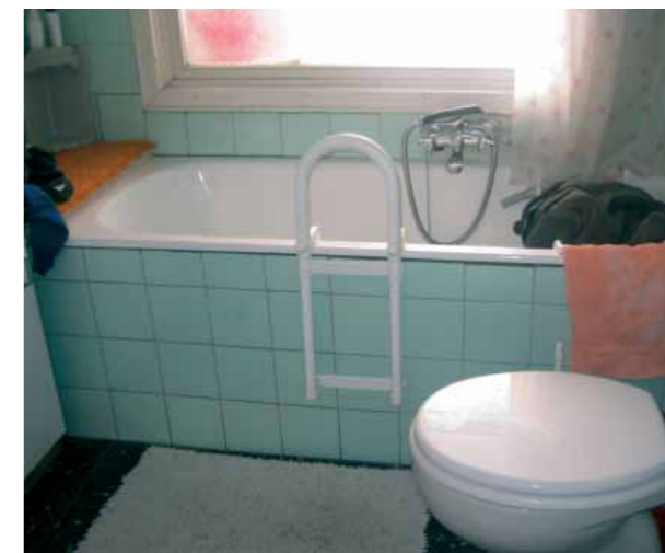
Maniglione: buona tenuta e sicurezza

Chi non è più in grado di fare il bagno, può sostituire la vasca con una doccia. Nella maggior parte delle abitazioni questa modifica può essere realizzata con il consenso del proprietario. In questo caso, si consiglia di installare la doccia a filo del pavimento.