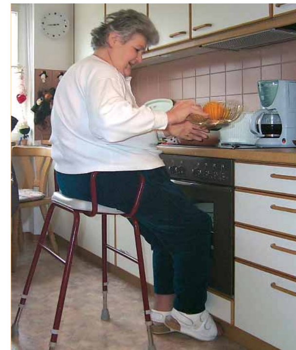
Un sedile rialzato facilita il lavoro

In genere è utile eliminare le fonti di pericolo ed evitare postazioni di lavoro scomode.