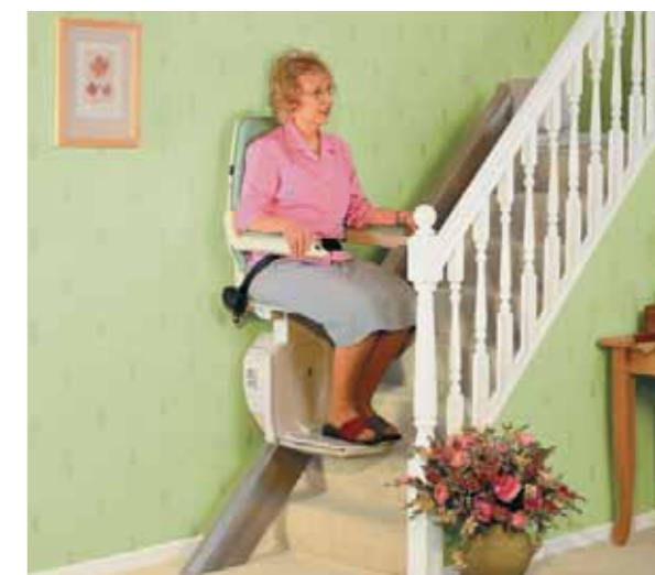
Il montascale: sono possibili adattamenti individualizzati

Probabilmente un montascale rappresenta la soluzione più adatta per chi non è più in grado di salire le scale da solo. Al giorno d'oggi il mercato propone molti modelli che, a seconda del tipo di scala, possono essere montati sia a parete sia sul lato interno della scala stessa. Se necessario, si può prendere in considerazione l'installazione o l'inserimento di un ascensore speciale per sedia a rotelle. Prima di effettuare qualsiasi intervento di modifica e per poter individuare il modello più adatto, è importante verificare le norme tecniche vigenti in materia di edilizia. Se in casa abitano più inquilini, può non essere possibile installare un montascale per non limitare l'utilizzo della scala come via di fuga. È possibile anche installare sistemi di supporto per consentire alle persone costrette sulla sedia a rotelle di salire le scale; questi sistemi richiedono però sempre la presenza di una persona in aiuto.