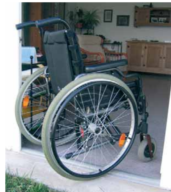
Senza soglia: libero accesso al giardino