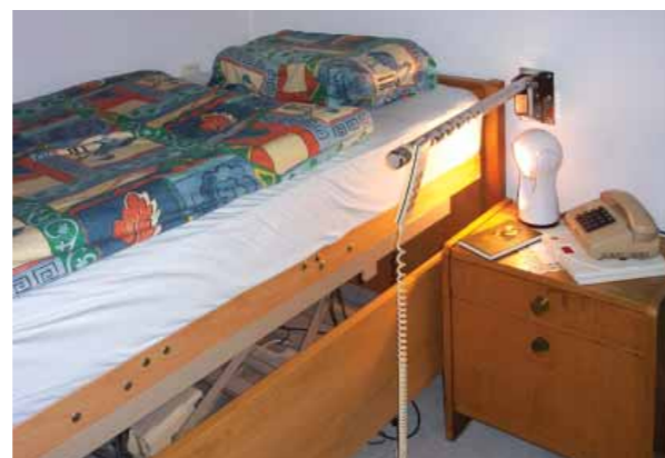
Maniglia per alzarsi e coricarsi in sicurezza