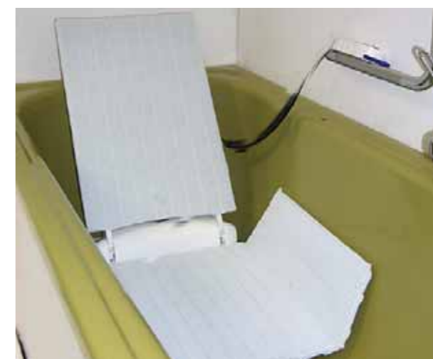
Il sollevatore rende possibile l'uso della vasca