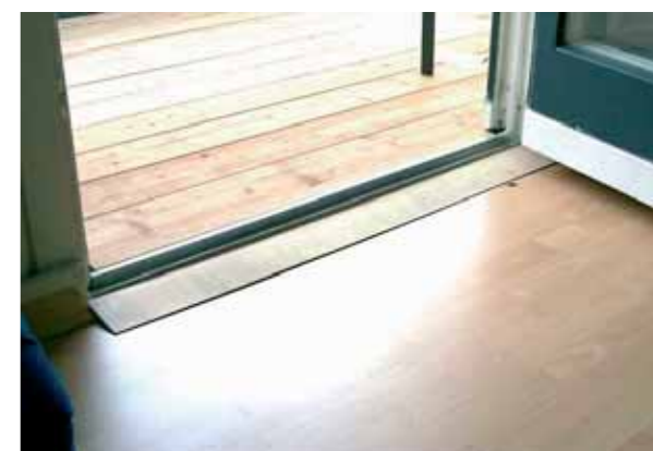
Dopo: senza ostacolo