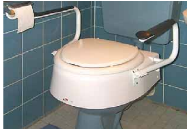
I maniglioni facilitano l'utilizzo del gabinetto