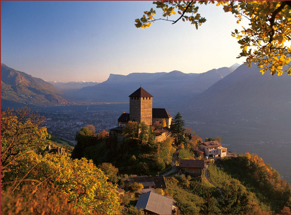
grafik e.w. schloss tirol