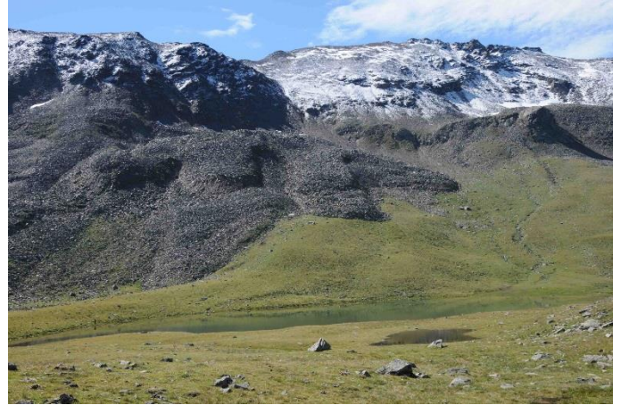
Das hintere Ultental: eine Schlüsselstelle für Geologie, Geomorphologie und Permafrost in den Ostalpen.

Santa Gertrude (1519 m) è l'idilliaco ultimo paese della Val d'Ultimo.