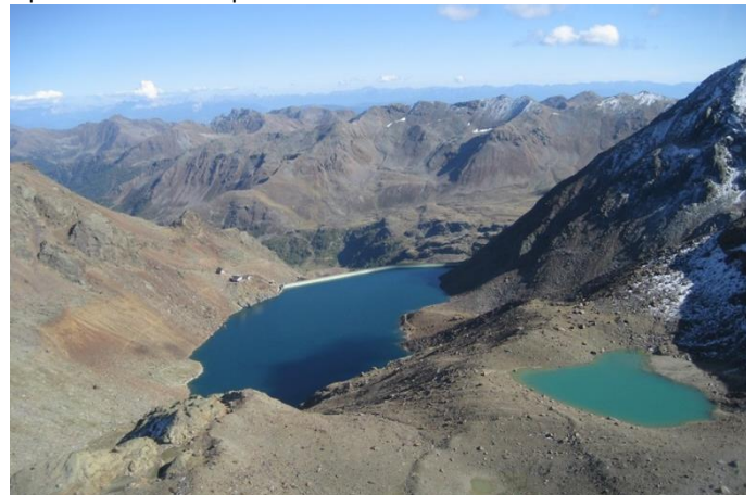
Gletschervorfeld mit dem Grünsee und der Höchsterhütte.

Specie pioniere colonizzano le aree periglaciali.