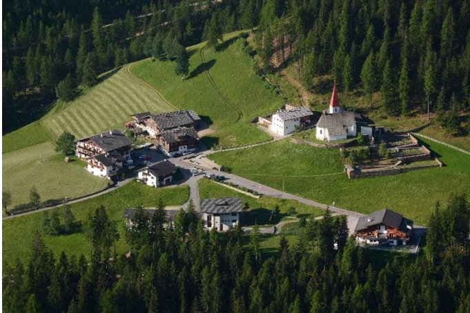
St. Gertraud (1519 m) ist das idyllische hinterste Dorf des Ultentales.

Santa Gertrude (1519 m) è l'idilliaco ultimo paese della Val d'Ultimo.