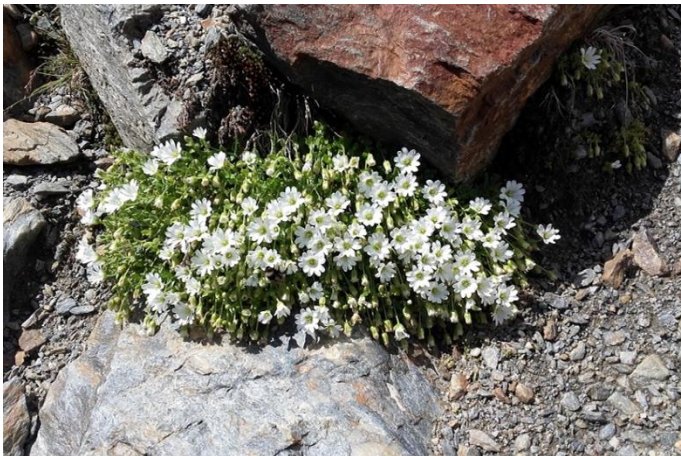
Pionierpflanzen kolonisieren neue Lebensräume.

L'Alta Val d'Ultimo: un eldorado per la geologia, la geomorfologia e il permafrost nelle Alpi orientali.