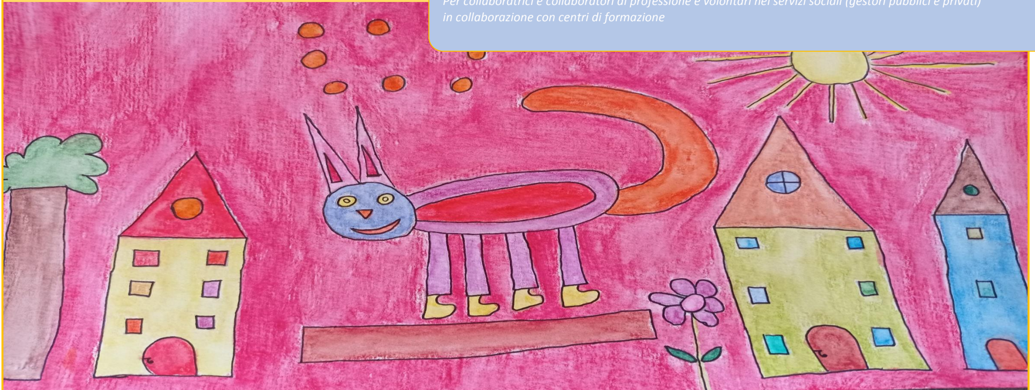
Design: Geschützte Werkstatt TRAYAH, Bezirksgemeinschaft PUSTERTAL/ Laboratorio protetto TRAYAH, Comunità Comprensoriale VAL PUSTERIA

Für haupt- und ehrenamtliche Mitarbeiterinnen und Mitarbeiter im Sozialwesen (öffentliche und private Träger) in Zusammenarbeit mit Bildungszentren Per collaboratrici e collaboratori di professione e volontari nei servizi sociali (gestori pubblici e privati) in collaborazione con centri di formazione