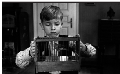
Film Still: Il nastro bianco

Marco Pagot è un asso dell'aviazione militare italiana che, in seguito ad un misterioso incidente durante la Prima guerra mondiale, al quale sopravvive miracolosamente, assume per magia l'aspetto di un maiale antropomorfo. Abbandona dunque l'aeronautica e la vita mondana (compreso l'amore per Gina, la bella cantante di un night club allestito su un'isoletta dell'Adriatico e frequentato da contrabbandieri) e si ritira sulla costa dalmata, guadagnandosi da vivere con le taglie poste sui pirati dell'aria che combatte con il suo monopiano dipinto di rosso (da cui il soprannome "Porco Rosso"). La sua abilità lo rende ben presto un ostacolo non indifferente per i Pirati dell'Aria, che per contrastarlo formano un'alleanza e ingaggiano un altro asso dell'aviazione, l'americano (Donald Curtis). Con l'aiuto di Donald, che si rivela essere un rivale all'altezza di Marco, i pirati riescono a depredate una lussuosa nave da crociera, quindi Donald raggiunge e affronta Marco che sta dirigendosi a Milano per far riparare il suo aereo.