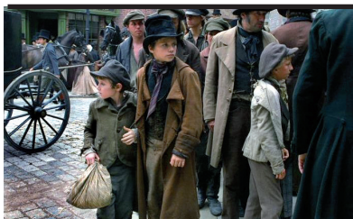
Film Still: Oliver Twist

Nel Kansas degli anni '30, ad un ambulante che vende Bibbie alle signore diventate da poco vedove, viene affidata la piccola Addie, di soli 9 anni. La ragazzina, nonostante la giovane età, si rivelerà una svelta, stravagante e incredibilmente valida collaboratrice. Scritta benissimo e diretta con garbo, è una commedia "sulla strada" che fece epoca. La piccola Tatum ruba il film al padre. Fu premiata con un Oscar. Bogdanovich conferma il suo amore per il vecchio cinema americano.