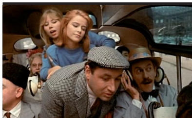
Film Still: Zazie nel metrò