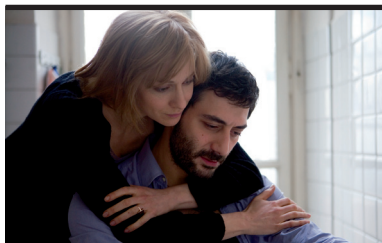
Film Still: La doppia ora Regia: Giuseppe Capotondi

Il film racconta il rapporto tra Sonia, una donna che viene da Lubiana e Guido, un ex-poliziotto che lavora come custode in una villa. I due si conoscono durante uno speed date. Quando i due stanno per innamorarsi, vengono entrambi coinvolti in una rapina che si concluderà con l'apparente morte di Guido. Sonia trascorre i giorni seguenti avendo sporadici ed inquietanti segni della presenza di Guido che lei pensava morto. Si scopre inoltre che la rapina era stata organizzata dal ragazzo di Sonia, con la complicità di Sonia. Seguono episodi drammatici quali la morte di Margherita (amica di Sonia) ed il tentativo di omicidio di Sonia da parte di un cliente dell'albergo nel quale lei lavora. Ben presto la verità viene a galla: durante la rapina il proiettile che aveva oltrepassato il corpo di Guido, senza causargli gravi lesioni, aveva successivamente colpito la testa di Sonia mandandola in coma. Le voci e visioni che lei sentiva durante il coma, erano in realtà reali manifestazioni della presenza di Guido al suo capezzale.