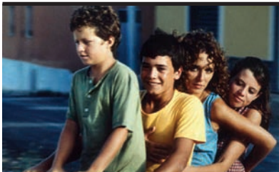
Film Still: Respiro Regia: Emanuele Crialese

Grazia, moglie di un pescatore che l'ama e madre di tre figli che l'adorano, è un po' strana, non in regola con gli usi e i riti di Lampedusa. Quando decidono di mandarla a Milano per farsi curare, con la complicità del primogenito si nasconde in una grotta. Valeria Golino è intensa e credibile. Il suo ritratto è in funzione di un'isola, del mare, del sapore di sale e dell'odore di pesce, dell'allegria dei ragazzi, di una piccola comunità incapace di accettare la diversità. Film sostenuto da un talento visionario e sensuale.