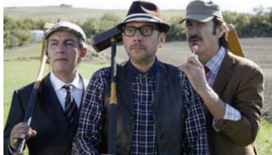
Film Still: La bellezza del somaro Regia: Sergio Castellitto

Nina Sayers è una ballerina che danza in una compagnia di ballo di New York che sta attraversando un momento di crisi. Abita con l'opprimente madre Erica, che le dedica attenzioni morbose e la tratta come una dodicenne, facendola vivere in una cameretta la cui porta non può essere chiusa a chiave e che è arredata come la stanza di una bambina invece che come quella di una giovane donna. Tuttavia, Nina sembra felice così. Una notte, sogna di essere la prima ballerina di una tenebrosa e inquietante versione de "Il Lago dei Cigni". Il giorno seguente nella metropolitana nota una ragazza, di cui non riesce a scorgere il volto, che compie dei gesti simili ai suoi in modo quasi speculare. Quando il direttore artistico Thomas Leroy annuncia la propria intenzione di sostituire Beth, la prima ballerina, e di voler allestire come spettacolo di apertura della nuova stagione teatrale "Il Lago dei Cigni", Nina spera che il suo sogno diventi realtà.