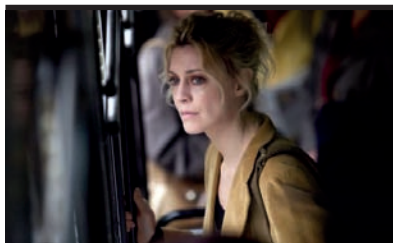
Film Still: Lo spazio bianco Regia: Francesca Comencini

Tutti siamo immortali e tutto è immortale