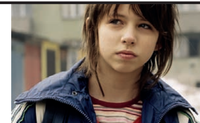
Film Still: Il segreto di Esmà Regia: Jasmila Zbanic

Juno è ancora una liceale quando rimane incinta di un suo amico; inizialmente pensa di interrompere la gravidanza, ma poi si ricrede e decide di avviare un'adozione con quella che all'apparenza sembra la miglior coppia che un bambino possa desiderare. È una commedia brillante, la storia di un piccolo prodotto indipendente volato agli Oscar, di un film nato dall'incontro tra la scrittura vivace della rivelazione Diablo Cody, l'humor di Jason Reitman ed il talento della giovanissima attrice Ellen Page.