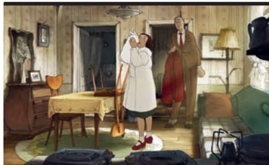
Film Still: L'illusionista Regia: Sylvain Chomet

2011 - Nomination al Golden Globe: miglior film straniero