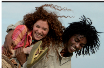
Film Still: Vai e vivrai Regia: Radu Mihaileanu