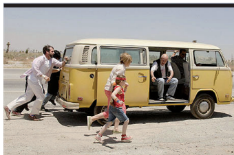
Film Still: Little Miss Sunshine Regia: Jonathan Dayton, Valerie Faris

Saga dei borghesi Carati, padre romano e madre milanese con due figli maschi e due femmine. Dall'estate 1966 ai giorni nostri; tre generazioni, da Roma a Palermo, da Capo Nord alla val d'Orcia, toccando alcuni dei grandi eventi collettivi di quel periodo: l'alluvione di Firenze, i movimenti giovanili, l'antipsichiatria, la lotta armata tra i '70 e gli '80, la strage mafiosa di Capaci. Di questo film corale sono protagonisti i due fratelli, Nicola psichiatra basagliano, e Matteo poliziotto spigoloso. In questo film di memoria contano i personaggi irripetibili e singolari.