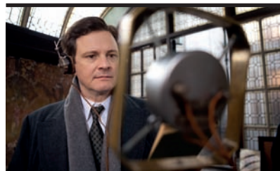
Film Still: Il discorso del re

Erede di una potente famiglia a capo di uno dei giornali più importanti della città, lasciato orfano dalla madre quando era piccolo e di nuovo alle prese con il lutto paterno in età adulta, Britt Reid è di colpo costretto a fare qualcosa della sua vita, dopo aver vissuto a lungo di baldorie inconcludenti. Grazie all'aiuto di Kato, un suo coetaneo talentuoso e tremendamente inventivo che il padre sottoutilizzava come meccanico, si trasformerà in il Calabrone Verde (Green Hornet), un giustiziere che si finge criminale per combattere meglio il crimine. Nonostante non sia capace di nulla e lasci fare tutto a Kato, lo stesso Reid riuscirà a infastidire il boss più boss di tutti della malavita cittadina e smascherare un complotto a cui suo padre aveva preso parte. Britt e Kato fanno esplodere numerose raffinerie di droga di Chudnofsky, lasciando il loro biglietto da visita per potersi far trovare dal mafioso. Il Procuratore Distrettuale teme che l'opinione pubblica possa pensare che non sia in grado di contrastare Green Hornet.