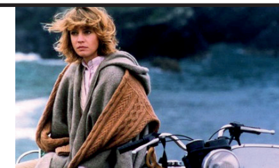
Film Still: Maledetto il giorno che t'ho incontrato Regia: Carlo Verdone

Racconta l'appassionata love story tra una rampante newyorkese fresca di divorzio e un artista più giovane di lei che si rivela essere il figlio dell'analista a cui la donna ha raccontato tutti i più intimi dettagli della loro relazione. Se la storia d'amore è carica di un romanticismo che intenerisce, le risate sono soprattutto affidate agli irresistibili duetti tra Uma Thurman e Meryl Streep. Infatti le ottime prestazioni delle due attrici rendono gradevole questa commedia sofisticata e agrodolce, maliziosa e affascinante.