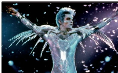
Film Still: Velvet Goldmine

Nel 1984 Arthur Stuart, giornalista di New York ma originario della Gran Bretagna, viene incaricato di svolgere una ricerca su un cantante glam rock scomparso delle scene, Brian Slade. Esattamente dieci anni prima, infatti, la popolare rock star aveva simulato il suo omicidio durante un concerto e da quel momento se ne erano perse le tracce. Il giornalista durante le indagini rivivrà la sua storia, essendo lui inglese e avendo frequentato l'ambiente glam che ora gli risulta tanto lontano da sembrare appartenere a una vita non sua; scova persone della vita di Brian che però non lo vedono, né hanno sue notizie da svariati anni. Il giornalista ricostruisce la storia ambientata nella swinging London, l'origine di Brian, la sua carriera e la sua vita privata. Scopre che Brian non è il suo vero nome, che è stato sposato con Mandy Slade e che ha collaborato con Curt Wild, musicista con il quale ha avuto una relazione. Scopre inoltre che dopo la messa in scena dell'omicidio si è quasi totalmente volatilizzato.