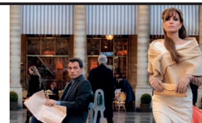
Film Still: The Tourist

Parigi. L'ispettore Acheson di Scotland Yard e la sua squadra tengono d'occhio l'affascinante Elise Clifton-Ward, ex amante di Alexander Pearce, ricercato dal governo e scomparso nel nulla dopo aver cambiato volto. Un giorno Elise riceve una lettera da Pearce che le indica di recarsi alla stazione, prendere un treno per Venezia, avvicinarsi ad un uomo che gli somiglia per altezza e corporatura, e far credere così alla polizia che quell'uomo sia il vero Pearce. Elise si reca alla Gare de Lyon e, salita sul treno, stringe amicizia con il turista Frank Tupelo, un insegnante americano che resta istantaneamente attratto da lei. La donna lo invita al suo albergo; la polizia intanto scopre l'identità di Frank e comprende l'inganno di Pearce. Contemporaneamente arriva a Venezia il gangster Reginald Shaw, al quale Pearce ha sottratto due miliardi prima di fuggire, che invia i suoi sgherri all'albergo convinto che Frank sia effettivamente Pearce.