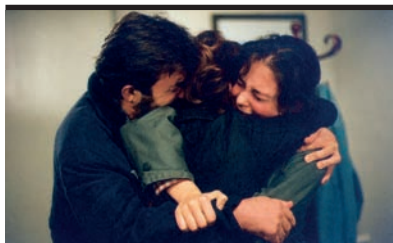
Film Still: La stanza del figlio Regia: Nanni Moretti

Sono in analisi da quindici anni Gli do un altro anno di tempo e poi vado a Lourdes