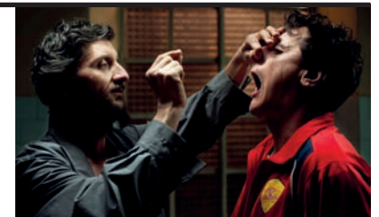
Film Still: La pecora nera Regia: Ascanio Celestini

Nicola ha trentacinque anni e vive rinchiuso in un ospedale psichiatrico, dove lo hanno dimenticato una mamma impazzita, una nonna "ovarola", un padre prepotente e due zii inadeguati. Le sue giornate sono scandite dalla spesa e accompagnate da una suora che prega e paga il conto e da un amico immaginario che conta le puzze della sorella e sogna di riviste per uomini senza parole. Al supermercato c'è Marinella, il suo amore infantile che offre caffè in cialde a clienti svogliati e ride ascoltando le sue cronache marziane. Nicola è un "povero scemo" che la guerra non l'ha mai fatta, che mangia ragni e beve l'acqua di mare, che crede ai santi ma non in Dio, che distribuisce pasticche e torna sempre indietro al novantanovesimo cancello perché è stanco, perché il mondo fuori è come dentro, soltanto più ordinato. Nicola è la pecora nera, il diverso che diventa poesia da declamare, storia da raccontare, canzone da cantare, pio pio pio.