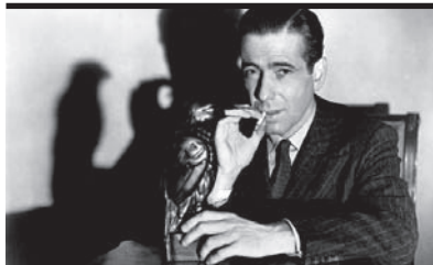
Film Still: Il mistero del falco Regia: John Huston