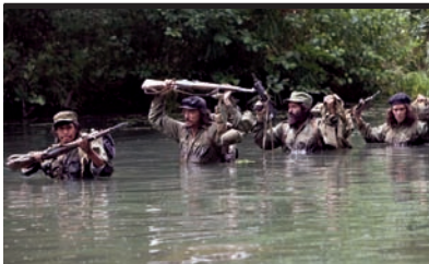
Film Still: Che – L'Argentino Regia: Steven Soderbergh

Ray e i suoi amici decidono di svaligiare una banca e, a tal scopo, affittare un locale vicino e da lì scavare un tunnel che porti alla banca stessa. Nel frattempo Frenchy, la moglie di Ray, farà da copertura vendendo biscotti. Il piano della rapina fallisce miseramente, e tuttavia il gruppo diviene milionario con la sola vendita di biscotti. Nasce una vera e propria azienda. Frenchy, ormai ricca, organizza una grande festa, durante la quale, per caso, ascolta i commenti di alcuni invitati che definiscono lei e Ray volgari e ridicoli. Allora chiede ad un certo David, di cui ha molta stima, di educare lei e il marito così che anche loro possano entrare nell'alta società. Ben presto Ray si stufa di tutto ciò, e mentre Frenchy continua a "istruirsi", il rapporto tra i due peggiora al punto che decidono di separarsi. Frenchy parte con David per l'Europa; mentre è lì, purtroppo, viene richiamata urgentemente in America, i contabili della sua compagnia, tutto è intestato a lei, l'hanno frodata e non le è rimasto più nulla.