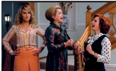
Film Still: Potiche – La bella statuina

Negli anni settanta del XX secolo, in una società divisa tra borghesia e classe operaia, Suzanne Michonneau è sposata con l'industriale Robert Pujol, un uomo maleducato ed altamente maschilista che la tratta come una "bella statuina" da tenere in casa. Vessata dal dispotico marito, che non le permette nemmeno di esprimere le proprie idee, Suzanne riuscirà a farsi valere. L'occasione arriva quando il marito, a causa di uno sciopero, di un sequestro e di un infarto, è impossibilitato a gestire la propria fabbrica di ombrelli, così Suzanne prende in mano la situazione, interagendo con i sindacati e gestendo nel migliore dei modi l'azienda, sorprendendo tutti, compresi i figli. Si rivela una donna intelligente e temeraria, pronta ad abbandonare il ruolo di "bella statuina" relegata a fare la casalinga. Le cose si complicano quando Robert è pronto per tornare alla guida dell'azienda, ma Suzanne, con l'aiuto del sindacalista comunista Maurice Babin, riuscirà a gestire la cosa.