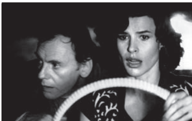
Film Still: Finalmente domenica! Regia: François Truffaut

Dal romanzo Il mastino dei Baskerville di Arthur Conan Doyle. L'erede dei Baskerville, una famiglia di nobiltà terriera, è minacciato da un'oscura maledizione della quale è già rimasto vittima Sir Charles. Sherlock Holmes è chiamato ad indagare sul mistero e a proteggere l'uomo. È il primo film di Sherlock Holmes a colori, interpretato in modo impeccabile da Peter Cushing. L'influenza dell'occultismo e di una più accentuata immersione in un contesto gotico caratterizza questa versione.