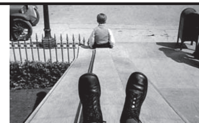
Film Still: Io ti salverò Regia: Alfred Hitchcock

Dal romanzo Quer pasticciaccio brutto de via Merulana di Carlo Emilio Gadda. Il furto avvenuto in un ricco appartamento e il cadavere trovato in un altro appartamento hanno qualcosa in comune? Il commissario Ingravallo indaga. Quando apparve fu considerato il miglior giallo del cinema italiano. I protagonisti sono presentati con abilità e ci appaiono nella dialettica contraddittorietà dei loro pregi e dei loro difetti. Su tutto il film domina la figura seria, un po' malinconica e di grande umanità del commissario.