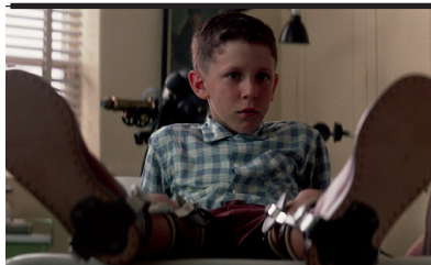
Film Still: Forrest Gump Regia: Robert Zemeckis

Il giovane Jong-du, quietamente asociale, uscito dal carcere corteggia Hang Gon-ju, affetta da handicap. All'inizio la loro è un'amicizia tormentata, poi lui fugge, ritorna e avvia con lei una relazione che diventa amore, osteggiato dalle famiglie. Lui le restituisce la femminilità; lei lo fa sentire adulto e responsabile. Il regista racconta la realtà che si cela dietro la rispettabilità delle convenzioni sociali. Definito dall'autore un film sui confini: tra normalità e handicap, tra vita e cinema, tra crudezza e poesia.