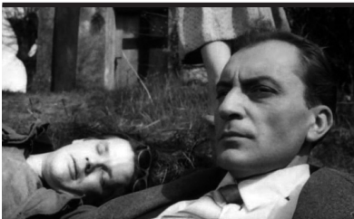
Film Still: Ceneri e diamanti

Il film segue le vicende, gli amori, i sogni e i desideri di sette ragazze che vivono nell'Istituto Grimaldi, un pensionato romano gestito da religiose. Vinca vive nel ricordo del fidanzato morto nella guerra di Spagna; Silvia è l'intellettuale del gruppo: assistente di un professore universitario, finisce per innamorarsene; l'affascinante Xenia dopo vari incontri conosce un industriale milanese e ne diviene l'amante; Emanuela è mamma di una bambina avuta da un aviatore morto; Milly, introversa e romantica, ama la musica e si innamora di un cieco ma muore improvvisamente; l'ambiziosa Valentina finisce per sposare un uomo di umili origini; il matrimonio di Anna con Mario conclude il film. Cominciato nel 1943, il film ebbe vita travagliata per le vicende belliche e politiche. Uscì nel 1945, a guerra finita, senza suscitare interesse, nonostante la fama del regista e la parata di dive. Visto oggi, è apprezzabile per il disegno dei personaggi e la cura dell'ambientazione.