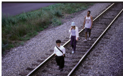
Film Still: Station Agent Regia: Tom McCarthy

* Il film Mai più come prima di Giacomo Campiotti citato nella Guida ai luoghi del cinema è stato girato in Alto Adige