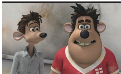
Film Still: Giù per il tubo Regia: David Bowers, Sam Fell

Cosa ci fa Roderick St. James, un nobiltopo che abita in una lussuosa dimora londinese nei pressi di Kensington, in una maleodorante fogna della City? Il nuovo lungometraggio animato firmato Dream Works e Aardaman (l'accoppiata vincente degli Oscar Shrek e Wallace & Gromit ), torna sugli schermi con un piccolo gioiello che mescola azione e divertimento alle più sofisticate tecniche animate. Roddy vive gli agi e i lussi di un'esistenza tranquilla fino all'arrivo di Sid, un topo di fogna che salta improvvisamente fuori dal lavandino della cucina. Il piano per liberarsi dell'intruso, subito messo in pratica, si rivela però inefficiente, tanto che lo stesso Roddy finisce giù per lo scarico del water e si ritrova nelle fognature sottostanti. Ed è proprio nell'underground londinese che lo spaurito roditore scopre un mondo parallelo abitato da creature strane e misteriose. Ma il desiderio del maldestro Roddy è uno solo: tornare a casa! Vite parallele, ricchezza e povertà, vermi che cantano canzoni d'amore ma anche ranocchi "reali".