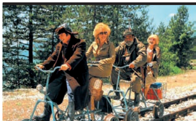
Film Still: La vita è un miracolo

Bosnia 1992. Luka, ingegnere arrivato da Belgrado in un paesino di montagna con moglie soprano un po' nevrotica e figlio abile calciatore, vede la sua vita mutare rapidamente. Lui è lì per costruire un tratto di linea ferroviaria ma la guerra scoppia, la moglie se ne va, il figlio viene fatto prigioniero e lui è richiamato nell'esercito. Per di più, quando gli viene affidata una giovane prigioniera musulmana se ne innamora. Kusturica è tornato con tutto il suo bagaglio ipertrofico di immagini, uomini e soprattutto animali. Ma, e questa è la novità, gli serve nella prima ora della sua nuova opera per tenerlo lontano dal centro del suo narrare: la possibilità dell'amore tra diversi anche nel bel mezzo del caos più totale. Quasi ne avesse paura, rinvia l'appuntamento con i sentimenti e appesantisce il film di una zavorra di "segni" che poi "miracolosamente" si rarefanno per lasciare spazio all'umanità (che è sempre messa a confronto con il mondo animale). Non teme l'happy end il nuovo Kusturica.