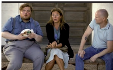
Film Still: Le mele di Adamo Regia: Anders Thomas Jensen

Adam, un giovane convinto neonazista, viene messo a svolgere servizio sociale di riabilitazione. Suo compito è quello di assistere Ivan, il sacerdote di un piccolo centro. Ivan chiede ad Adam di cucinare una torta con le mele dell'albero del giardino dinanzi alla chiesa. Tutto ruota intorno alle mele del giardino, ora rigogliose, ora minacciate. La lotta fra Bene e Male, fede e nichilismo, in questo film viene vista come l'incrocio fra una black comedy e un western politicamente scorrettissimo.