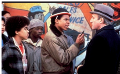
Film Still: Oltre il giardino