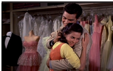
Film Still: West Side Story Regia: Robert Wise, Jerome Robbins

Nella Berlino del 1931, Sally canta in un cabaret e arrotonda il suo stipendio intrattenendo facoltosi signori; è innamorata di Brian, un intellettuale britannico, che però non può darle la sicurezza che lei, vivendo alla giornata, talvolta desidera. Alla storia di Sally si intrecciano quelle di altri personaggi. La magnifica colonna sonora, alcuni numeri di varietà indimenticabili, l'energia di Liza Minnelli e la magistrale regia di Bob Fosse, rendono questo film, un capolavoro del musical moderno.