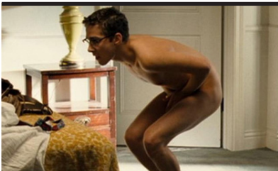
Film Still: Bobby Regia: Emilio Estevez

4 giugno 1968. Si stanno svolgendo le elezioni per le primarie democratiche in California, un test decisivo per la corsa verso la candidatura per la Presidenza degli Stati Uniti. Le ore di quella giornata scorrono verso la speranza di una possibile vittoria di Bob Kennedy sull'avversario McCarthy. Si chiuderanno nelle prime ore del 5 giugno con i colpi di pistola sparati da Sirhan Sirhan che stroncheranno non solo la vita di un uomo ma le speranze di quell'America che vuole uscire dalla follia della guerra nel Vietnam. Emilio Estevez decide di raccontarcele non seguendo, più o meno documentaristicamente, le 'ultime ore' del candidato ma proponendoci altmanianamente la vita delle persone che si trovano, per i più diversi motivi, nell'Hotel Ambassador quartier generale dei Democratici. Dal direttore fedifrago con moglie, al cameriere immigrato che vorrebbe poter andare ad assistere alla partita ed è costretto a lavorare; è un concatenarsi di storie che ci mostrano uno spaccato dei sogni e delle frustrazioni degli Stati Uniti di quei giorni.