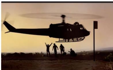
Film Still: Valzer con Bashir

Questa tipica commedia all'italiana, dal ritmo andante, presenta il personaggio (forse un po' teatrale nella sua schematicità), dello zio anziano, una volta affascinante, ma tuttavia irresponsabile, disinibito, lascivo, ed amante del divertimento, che mostra le sue analisi del sangue ad ogni donna disponibile presente nei paraggi, con l'idea di farla diventare sua partner. Mostrando questi certificati vuole provare che Lui è "pulito" (rispetto al nipote un po' malaticcio) e genera ogni sorta di trambusto durante la breve stagione nella quale si prende cura del nipote ricco, malato, ed emozionalmente inibito. All'inizio il nipote rimane allibito e scandalizzato dalla bramosia dello zio per una vita selvaggia e lussuosa, ma col tempo si affeziona per infine rimanere affascinato dall'ansia vitalistica dell'anziano. Presto il giovane riservato e con "la testa a posto" si troverà invischiato nel demenziale stile di vita dello zio, e comincerà ad apprezzare il valore del vivere la vita con "l'acceleratore a piena manetta".