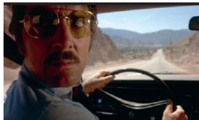
Film Still: Duel Regia: Steven Spielberg

Sailor, in libertà vigilata, e Lula, scappata di casa, si amano follemente e tentano di raggiungere il Texas. Thriller d'inseguimento che ha cadenze di film nero e i modi di un film di strada. Lynch connota la sua storia maledetta del profondo Sud con una dimensione ironica e parodistica che ne rovescia il senso e ne rivela la vera natura di favola comica, nel significato "basso" della parola, ma anche vicino al fumetto, quella di due innamorati che attraversano un mondo atroce dal cuore selvaggio.