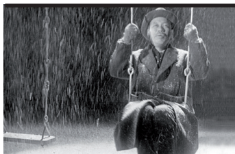
Film Still: Vivere Regia: Akira Kurosawa

Malato di tumore, anziano funzionario giapponese si dedica interamente all'impresa di trasformare una zona palustre in un campo di giochi per bambini. Quando muore, soltanto le madri dei bambini si ricordano di lui. Potente affresco di vita giapponese con una struttura narrativa insolita (per l'epoca), permeato di un'angoscia esistenziale che rimanda a Dostoevskij, indimenticabile ritratto di un uomo solo davanti alla morte, è uno dei grandi film sulla vecchiaia in cui convivono emozione e rigore, realismo e simbolismo, lirismo e sarcasmo.