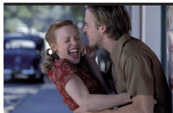
Film Still: Le pagine della nostra vita

Un vecchio medico parte in auto con la nuora, carica una coppia di autostoppisti, va a trovare la vecchissima madre, arriva all'università di Lund dove si festeggia il suo giubileo, il 50. anniversario della sua attività professionale. Alle vicende del viaggio si alternano sogni, incubi, ricordi che si fanno parabola sulla morte nascosta dietro le apparenze della vita. È, forse, il più alto risultato di Bergman negli anni '50. Orso d'oro al Festival di Berlino 1958 e molti altri premi. Il grande regista e attore Sjöström (1879-1960) morì 3 anni dopo le riprese.