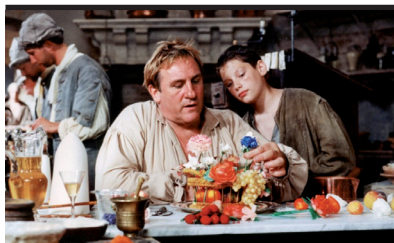
Film Still: Vatel Regia: Roland Joffé