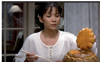
Film Still: Mangiare bere uomo donna

Don Felice, lo scrivano pubblico, e don Pasquale, fotografo ambulante, vivono con le loro famiglie nello stesso povero quartierino di Napoli. La fame è tanta. L'occasione di mettere qualcosa sotto i denti si presenta quando un giorno ricevono la visita del marchese Eugenio, che fa loro una strana proposta. Nel film il concetto di gioia legata al cibo viene espresso da Totò che balla sul tavolo con gli spaghetti in mano, dopo aver ricevuto un inatteso e ricco carrello di vivande da un benefattore sconosciuto.