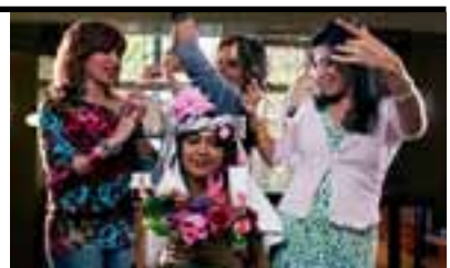
Film Still: Caramel Regia: Nadine Labaki