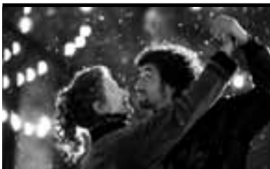
Film Still: Lezioni di tango Regia: Sally Potter

A Roma la scombinata famiglia Forbicioni ospita la giovinetta Mignon che viene da Parigi. È un po' antipatica, ma turba i sogni del cugino Giorgio cui lei, però, preferisce un ragazzo di borgata. Poi parte e la vita continua. "Dolce amara commedia d'amore nella quale Francesca Archibugi ha saputo condire l'intelligenza e la sensibilità con l'astuzia in un'ottica femminile. Calibrata direzione d'attori, piccoli e non. La Sandrelli emerge di una testa su tutti." (Laura e Morando Morandini).