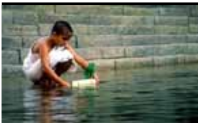
Film Still: Water Regia: Deepa Mehta

L'ermafroditismo è la presenza simultanea in un individuo di ghiandole sessuali maschili e femminili. È ermafrodita Alex che, subito dopo la nascita, i genitori portano a vivere in un villaggio isolato della costa uruguayana, con la speranza di suscitare meno interesse morboso per lei. La Puenzo dirige un film su un tema inedito e impervio che non è solo una ricognizione, magistrale per equilibrio narrativo e pudica leggerezza, del pianeta adolescenziale, ma un apologo sulla difficile libertà della scelta.